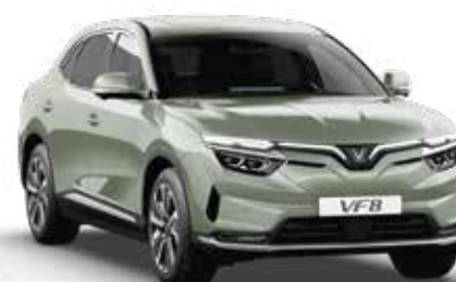
Xanh lá nhạt Urban Mint