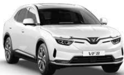
Trắng Infinity Blanc