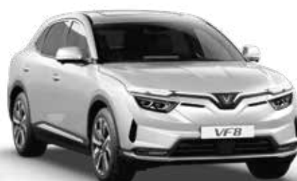
Bạc Desat Silver