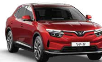
Đỏ Crimson Red