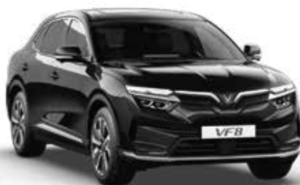
Đen Jet Black