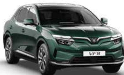
Xanh lá đậm Ivy Green