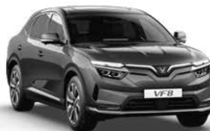
Xám Zenith Grey